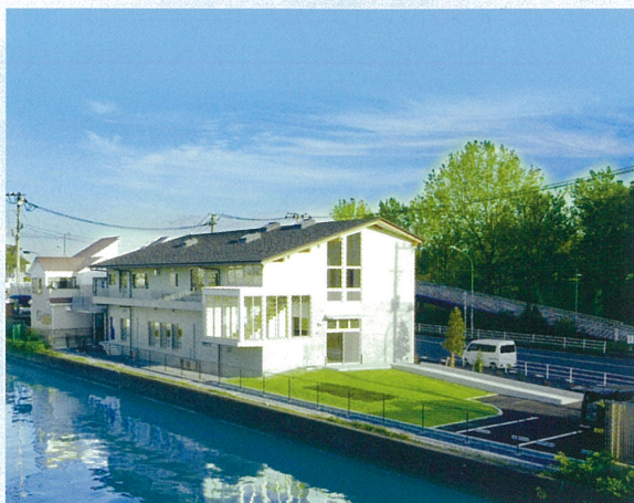
ヨコハマ出身の ストロングマシーン・J